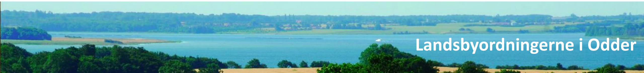
Landsbyordningerne i Odder